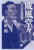
威風堂々 作 / 伊東潤