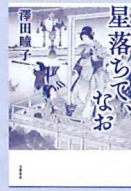
星落ちて、なお 作 / 澤田瞳子