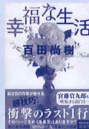
福な生活 作 / 百田尚樹