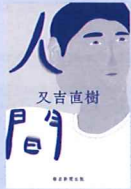
人間 作 / 又吉直樹