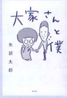
大家さんと僕 作 / 矢部太郎

公民館のふれあい文庫（図書室）を利用しませんか？本を借りたり、読んだり、フリースペースとして利用することもできます。新しい本がたくさん入りました。ぜひ、ご利用ください。