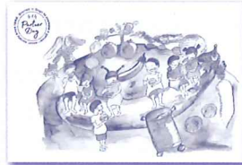
※メッセージカードは、公民館に置いています。