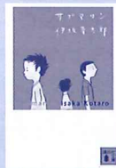
サブマリン 作 / 伊坂幸太郎