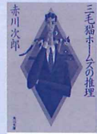
三毛猫ホームズの推理 作 / 赤川次郎