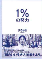
1%の努力 作 / 西村博之