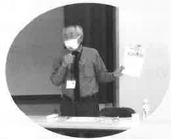
日本赤十字社 「新型コロナウイルスの3つの顔を知ろう！」より