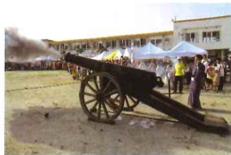
坂井市長他4名によるカノン砲 試射

出店を出していただいた各自治会や各種団体の皆さん、事前の準備から翌日の後片づけまでご協力いただいた役員の方々はじめ、多くの皆様、本当にありがとうございました。