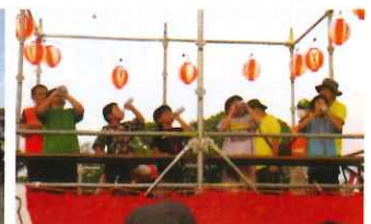
ラムネ早飲み競争

4年ぶりに参加を予定した栄の国まつりの子どもみこしの前で記念撮影をしました。日新名物の大地と太陽のみこしは今年で最後となり、長い歴史の締めくくりとなりました。まつり当日は熱中症アラート発令の恐れがあり、残念ながら参加は見送りました。