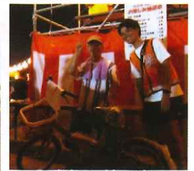
お楽しみ抽選会 1等 自転車当選！