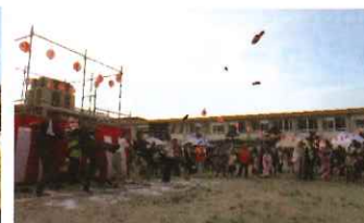
スリッパとばし大会