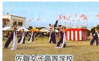
佐賀女子高等学校 新体操部の美しい演舞