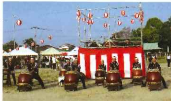
和太鼓「葉隠」の力強い演奏