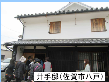
井手邸(佐賀市八戸)