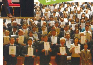
平成28年に 福岡で開催された 公開講座の様子。