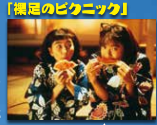
鈴木純子 (芹沢紗織)