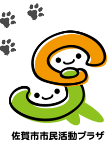
佐賀市市民活動プラザ