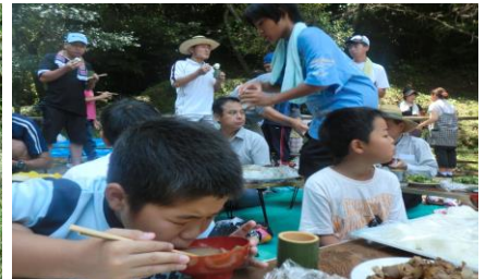
そ-めんや川魚の天ぷらを食べます