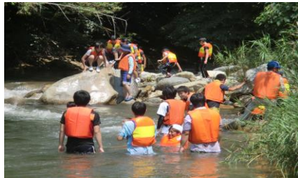
岩の上から深水へ跳びこんだり、泳いで楽しい