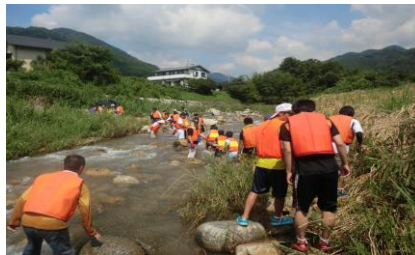
滑る石に足を取られヨロヨロ