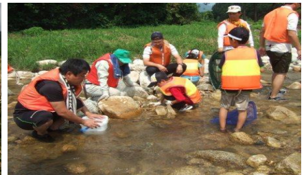
水中生物調査 何がいるかな～