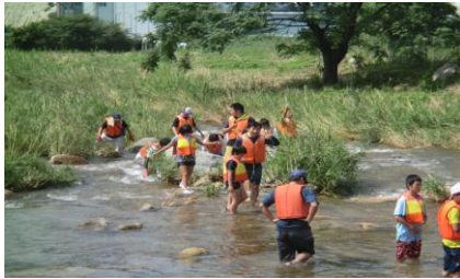
上流へと進みます