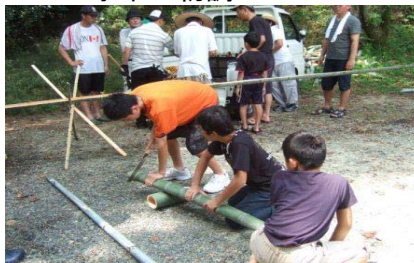
そめん流し設営し竹食器作り