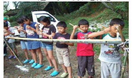
そめんや川魚の天ぷらを食べます