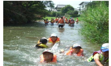
プールと違い水の流れを体感