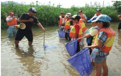
清流の魚取りの説明