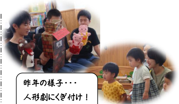
昨年の様子・・・ 人形劇にくぎ付け！