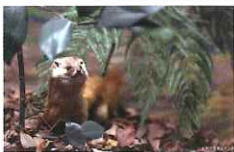
佐賀の森林のジオラマ

「佐賀の大地」と「佐賀の生き物」をテーマに、岩石や化石、野鳥や有明海の生物の標本などを展示しています。