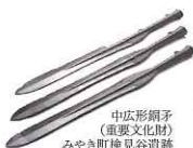
中広形銅矛 (重要文化財) みやき町検見谷遺跡

原始・古代から近代までの佐賀の歴史を通史展示しています。吉野ヶ里遺跡出土資料や佐賀の七賢人に関する資料等、多彩な資料をご覧ください。