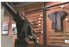
玄界灘の捕鯨用具

佐賀県内の民俗資料を一堂に紹介しています。国指定の重要有形民俗文化財である有明海漁撈用具など、佐賀ならではの貴重な資料を多数ご覧いただけます。