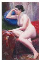
《裸婦》昭和10年(1935年) 佐賀県重要文化財