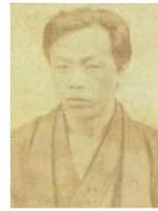
江藤新平 - 農都の建議 -

2020年に東京オリンピック・パラリンピックが開催されます。日本の首都で世界有数の大都市である東京の成り立ちに、佐賀人の貢献がありました。この特別展では、多くの人々が憧れる大都会・東京をテーマに、普段は見ることのできない多彩な実物資料やグラフィックの展示により紹介します。