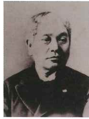
大木善任 - 第二代東京府知事 -