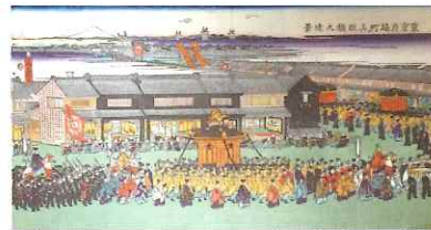
東京府通町呉服橋之遠景

2020年に東京オリンピック・パラリンピックが開催されます。日本の首都で世界有数の大都市である東京の成り立ちに、佐賀人の貢献がありました。この特別展では、多くの人々が憧れる大都会・東京をテーマに、普段は見ることのできない多彩な実物資料やグラフィックの展示により紹介します。