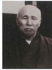
大隈重信 - 鉄道・銀座煉瓦街 -