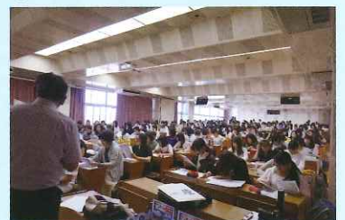
2019年5月23日に行われた佐賀女子短期大学での新入生(留学生を含む)セミナー

日本で働き、日本で定住していただける世界の方々に大切にし、地域とともに生活できる状況を作り出していくことが、佐賀県労福協の「国際貢献」なのではと思います。