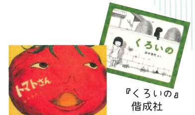
『トマトさん』 福音館書店