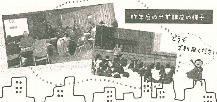
昨年度の出前講座の様子