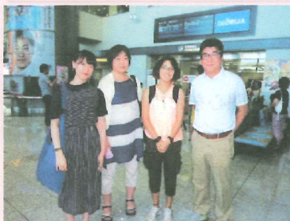
〈 まずはおでむかえ!! 〉

佐賀県教育委員会では、海外から佐賀県を訪れる外国人留学生等を受け入れてくださるホストファミリーを募集します。ホストファミリーになって、日々の生活の中で留学生との交流を通して世界を身近に感じてみませんか。ぜひ、ホストファミリーバンクにお申込みください。