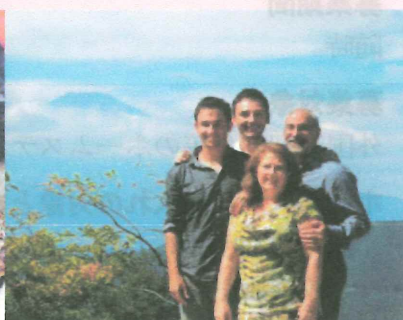
〈 いっしょにお出かけ!! 〉