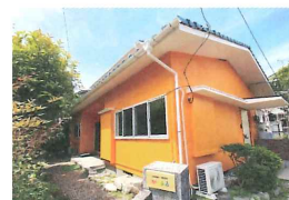
【要配慮者用シェアハウス】

手付かずの空家をリノベーションし、2020年6月現在2棟のシェア物件を運営しています。