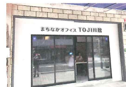
【CSO用シェアオフィス】