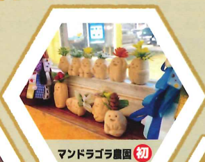
マンドラゴラ園 初