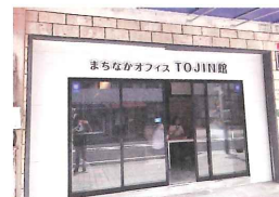
【CSO用シェアオフィス】