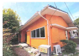
【要配慮者用シェアハウス】

手付かずの空家をリノベーションし、2020年6月現在2棟のシェア物件を運営しています。