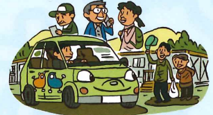
被災地などの 地域で大活躍！