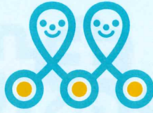
日本カーシェアリング協会