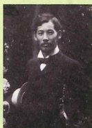
岡田三郎助 (明治39年撮影)

佐賀生まれ、日本近代洋画の礎を築いた洋画家・岡田三郎助。館蔵の作品を中心に、その名品をご覧ください。展示を通じて、岡田三郎助の画業や生涯、その芸術の素晴らしさをダイナミックにお伝えします。