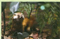
佐賀の森林のジオラマ

「佐賀の大地」と「佐賀の生き物」をテーマに、岩石や化石、野鳥や有明海の生物の標本等を展示しています。