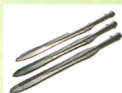
中広形銅矛(重要文化財) みやき町検見谷遺跡

原始・古代から近代までの佐賀の歴史を通史展示しています。吉野ヶ里遺跡出土資料や佐賀の七賢人に関する資料等、多彩な資料をご覧ください。