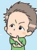
佐賀市で暮らす Tさん

必要な情報を知りたい時、どうしたらいいんだろう？ いろんな情報があるけど、わかりやすく伝えてもらえたらいいなあ。