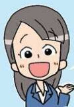
市役所職員の Sさん