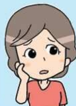
ボランティア団体の Aさん