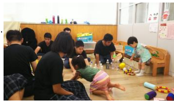
昨年の様子・・・ 人形劇も本格的！

これまでの活動に対して、「小さな親切」実行章、善行表彰（日本善行会）、善行児童生徒表彰（県教育長表彰）などの受賞をされています。