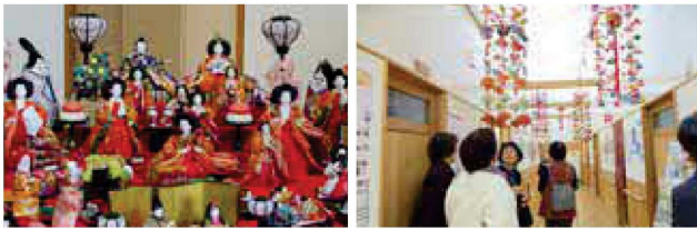
（写真は昨年の様子）