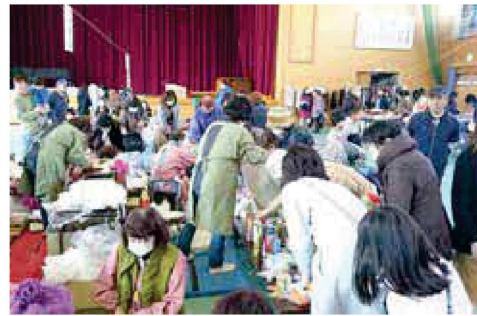
（写真は昨年の様子）