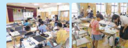
(写真は一昨年の様子)

日時: 7月26日(月)～7月30日(金) 場所: 新栄公民館 大会議室 内容: 書道・書き方、ポスター、その他の宿題 ほか 定員: 各日20名程度