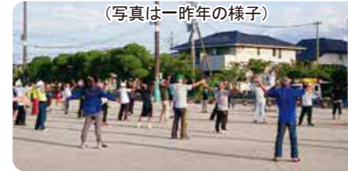
(写真は一昨年の様子)

日時：7月25日(日) 6:00集合(約1時間程度) 場所：新栄小グラウンド 対象：校区の方ならどなたでも 主催：新栄まちづくり協議会 福祉健康部会 共催：新栄公民館