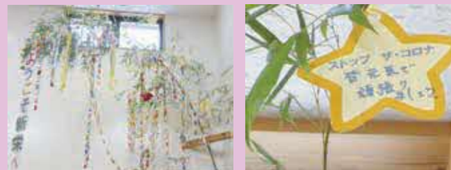
(写真は昨年の様子)

期 間: 6月25日(金)～7月7日(水) 場 所: 新栄公民館 ホール 主 催: 新栄まちづくり協議会 本部