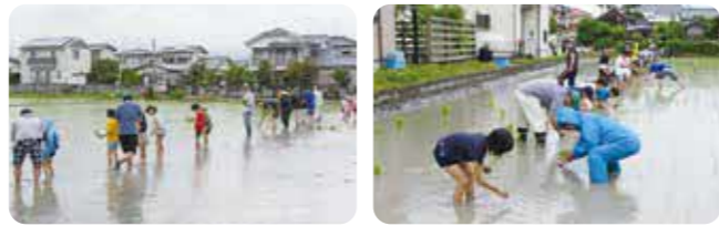
(写真は一昨年の様子)

※新型コロナウイルス感染拡大防止のため中止の場合があります。公民館へおたずねください。