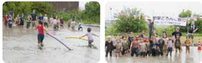
(写真は一昨年の様子)