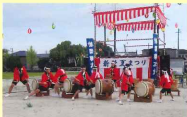
新栄樽太鼓によるオープニング

久しぶりの開催でしたが、準備等にあってはスタッフのみなさんそれぞれ積極的に活躍され4年のブランクが感じられませんでした。新栄校区を大切に思う新栄校区住民のエネルギーを感じた夏まつりでした。