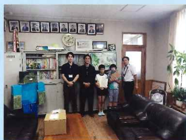
横に並んで 記念撮影

令和5年8月31日（木）に下敷きの贈呈式がありました。約400枚、全校児童一人一人の分が用意されていました。この下敷きは、佐賀市諸富町の「オチアイ」という家具工場から提供されたものです。家具を作るときに出てくる廃材で作ったものですが、光沢があり大変豪華なものです。捨てるにはもったいないので、下敷きサイズに切り分けて、県内の小学校に配布しているものです。そのようなわけで、環境教育の一環、SDGsの意識付けのため、新栄小でもいただくことにしました。配付後は、子どもたちには大事に使うように呼びかけました。