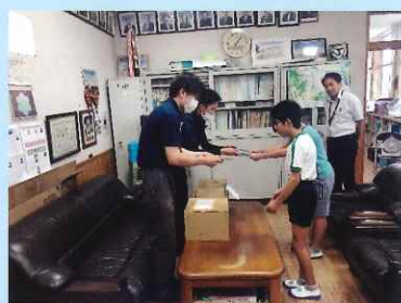
6年生代表 下敷きをいただく