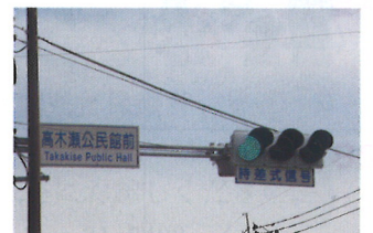
車の流れも要確認！