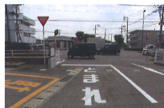
一時停止後、安全確認！