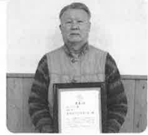
キラリ賞(団体の部) 若楠子ども見守る会