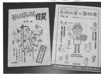
寄贈いただいた本