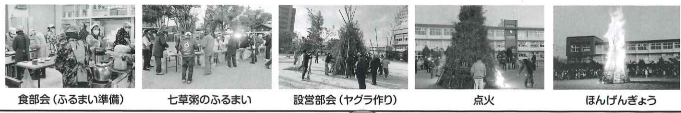
食部会(ふるまい準備) 七草粥のふるまい 設営部会(ヤグラ作り) 点火 ほんげんぎょう