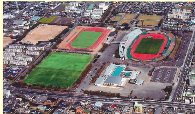
佐賀県総合運動場